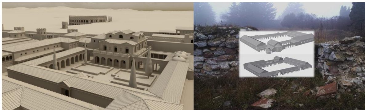
„Константиновият дворец“ в Сердика, 3 Д реконструкция А. Димитров и Дворецът Скретиска (3 Д реконструкция О. Давчев).

Другият вариант е бил интеграцията да се е реализирала на равнище, различно от формалното включване на периферната зона в градската територия и администрация. Подобно интегриране, изглежда, е било достатъчно разпространено в римската практика. Типичен пример е интегрирането на Остия във функциониращата отдалечена на ок. 23 км Рим или на Тиволи, отстоящ на ок. 30 км от Вечния град. Това равнище е видимо на първо място в едновременното запазване на значителна автономия на двете градски територии и диференцирането на техните функции. Разделянето на функциите на свой ред често се отразява във факта, че знакови обществени съоръжения, каквито вече са съществували в едната част, не са били дублирани в другата част. За епохата на най-ранната градска история на Сердика и Скретиска (както се е наричало тогава селището на мястото на Костинброд) такива знакови обществени съоръжения са били дворците, някои емблематични храмове, стените и огромните амфитеатри.